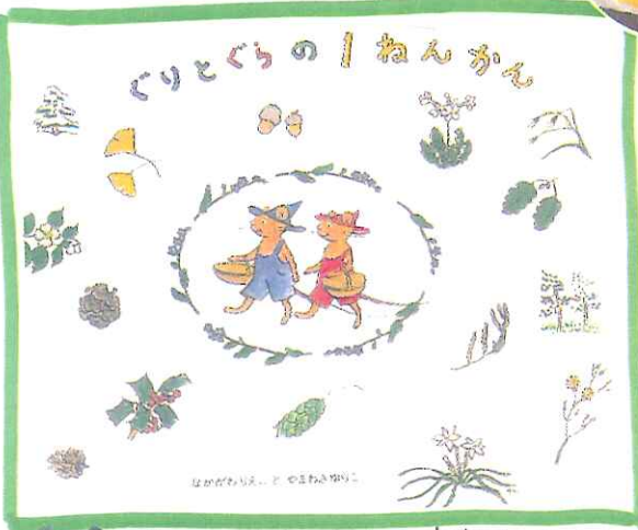
絵本: ぐりとぐらの「ねんかん」 なかがわりえことやまわきゆりこ