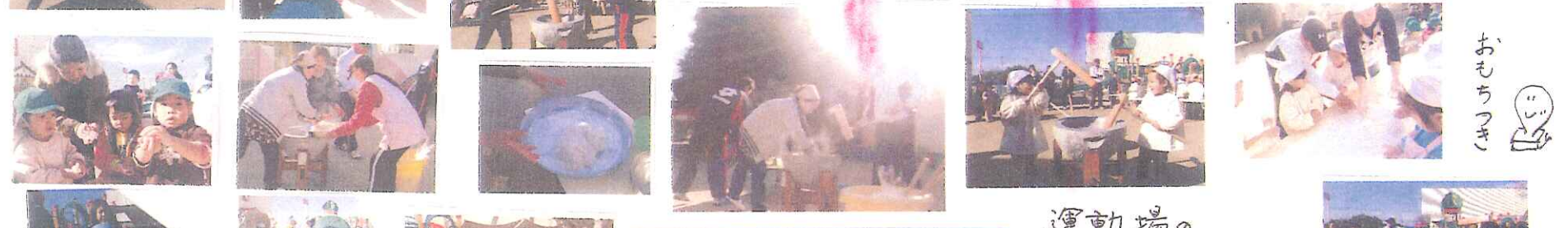
運動場の 大きなケヤキの木も 葉を落とし、どしりと 私達を見守ってくれています。